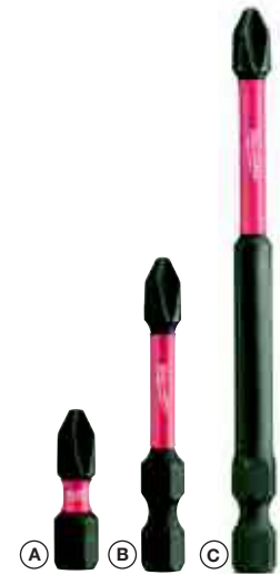
A) 25 mm 1/4" Hex - DIN 3126 - C 6.3 B) 50 mm 1/4" Hex - DIN 3126 - E 6.3 C) 90 mm 1/4" Hex - DIN 3126 - E 6.3