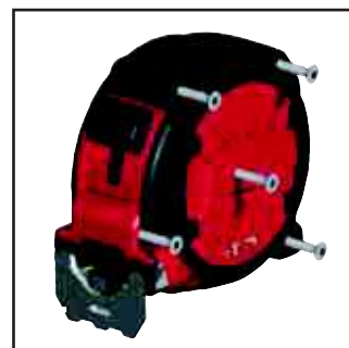
5-punktowe wzmocnienie obudowy