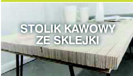
STOLIK KAWOWY ZE SKLEJKI

Zobacz jakie projekty można samemu wykonać w domu i w ogrodzie.