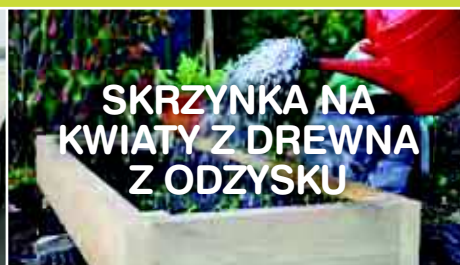
SKRZYŃKA NA KWIATY Z DREWNA Z ODZYSKU