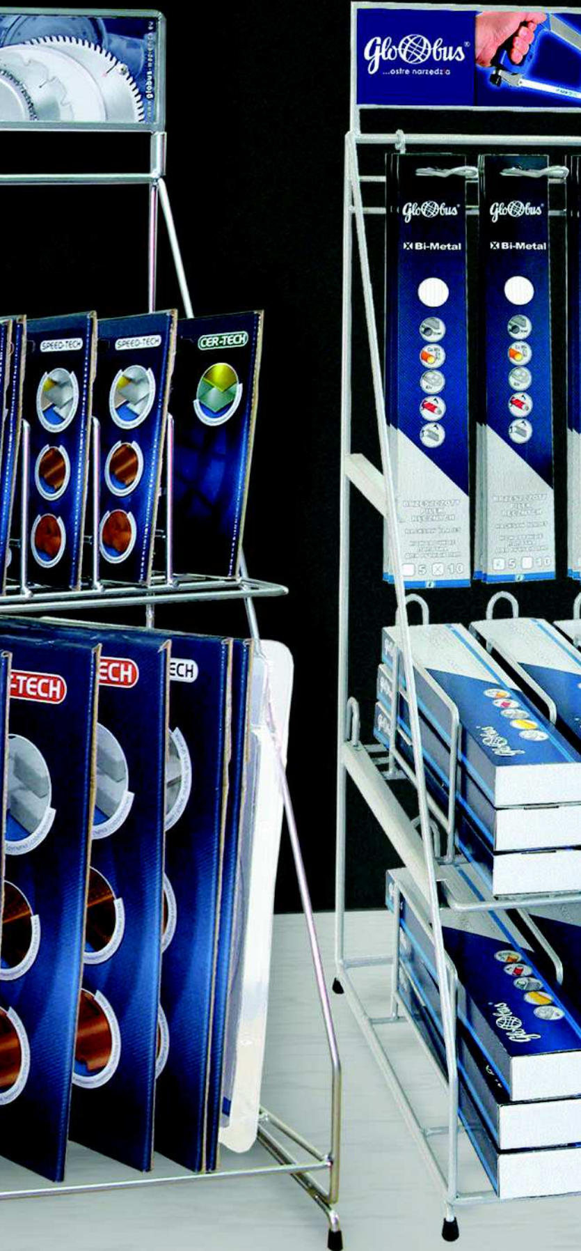
DZIAŁ V SYSTEMY EKSPOZYCJI NARZĘDZI